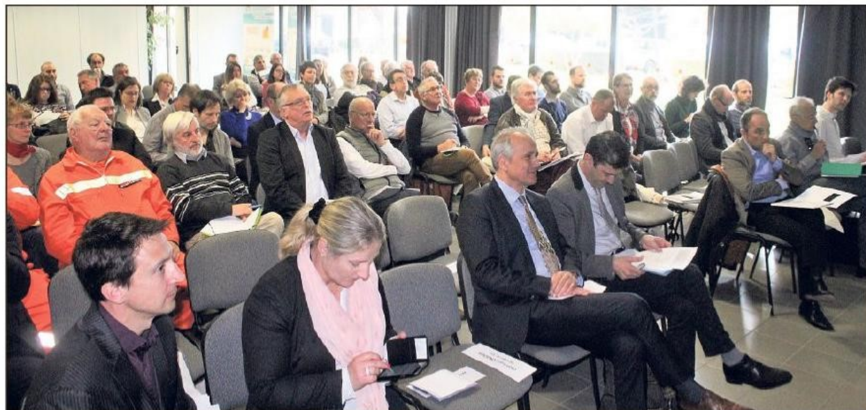
Soixante-dix personnes ont assisté aux travaux.