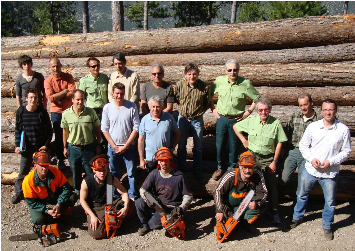
Salle de spectacle à Mazan (Vaucluse) – 2012 – Une photo rare : tous les intervenants du projet en forêt ! Maître d'ouvrage : Commune de Mazan – Architectes : François DEFRAIN – Olivier SOUQUET