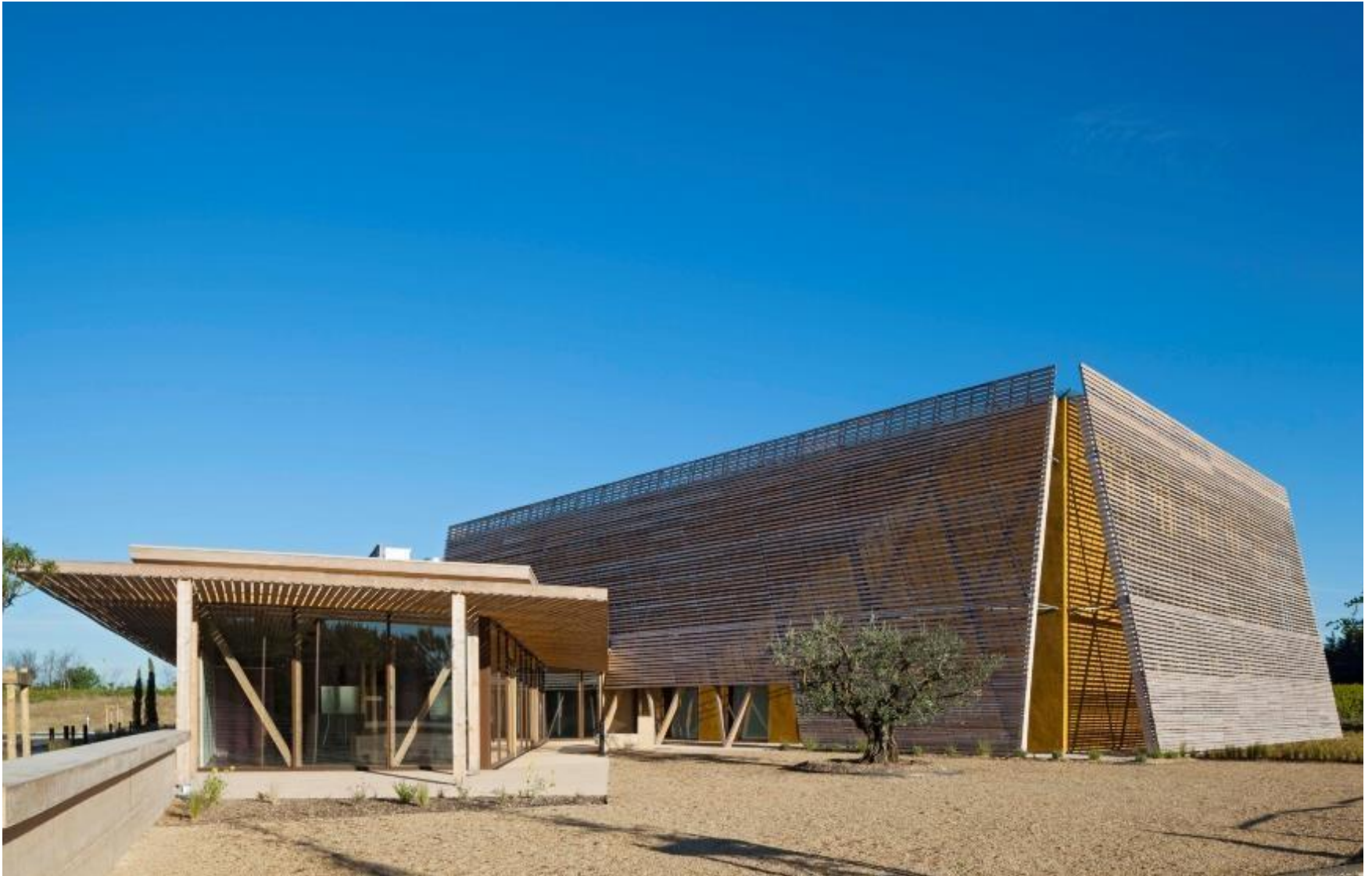
Salle de spectacle à Mazan (Vaucluse) – 2012 – Vue extérieure après 3 ans d'exposition aux intempéries Maître d'ouvrage : Commune de Mazan – Architectes : François DEFRAIN – Olivier SOUQUET