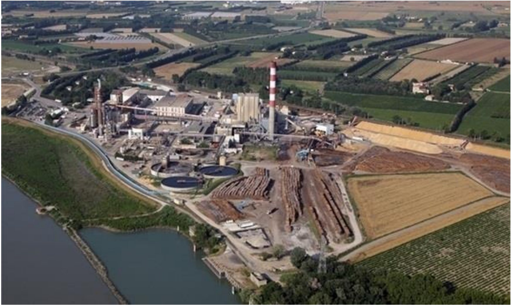
Salle de spectacle à Mazan (Vaucluse) – 2012 – Papeterie de Tarascon Maître d’ouvrage : Commune de Mazan – Architectes : François DEFRAIN – Olivier SOUQUET