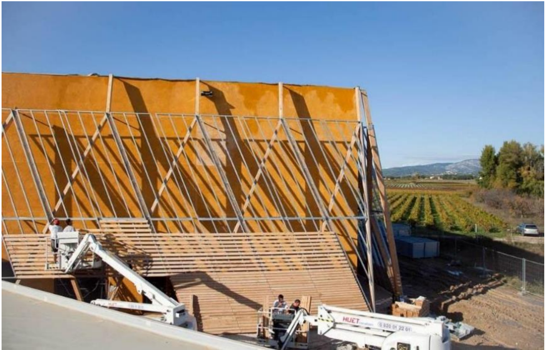
Salle de spectacle à Mazan (Vaucluse) – 2012 – Mise en œuvre du bardage en cèdre Maître d'ouvrage : Commune de Mazan – Architectes : François DEFRAIN – Olivier SOUQUET