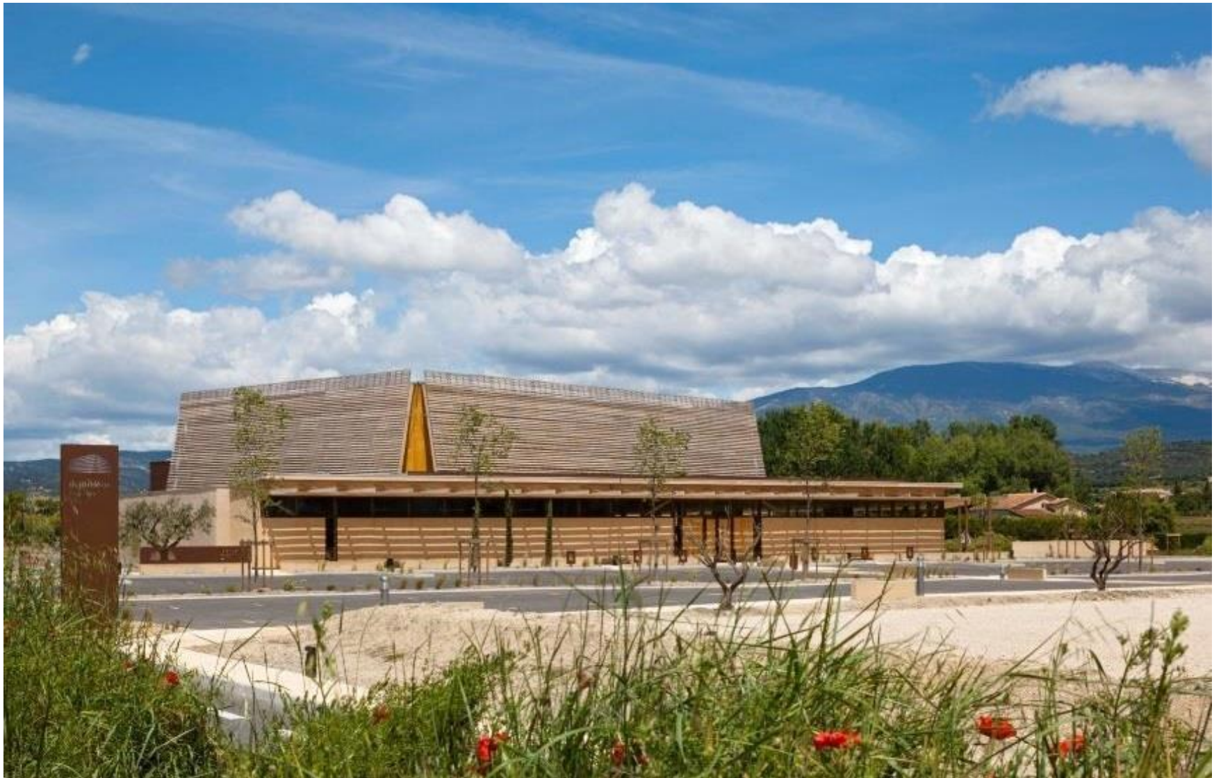
Salle de spectacle à Mazan (Vaucluse) – 2012 – Structure bois local, isolation paille et enduit plâtre Maître d'ouvrage : Commune de Mazan – Architectes : François DEFRAIN – Olivier SOUQUET