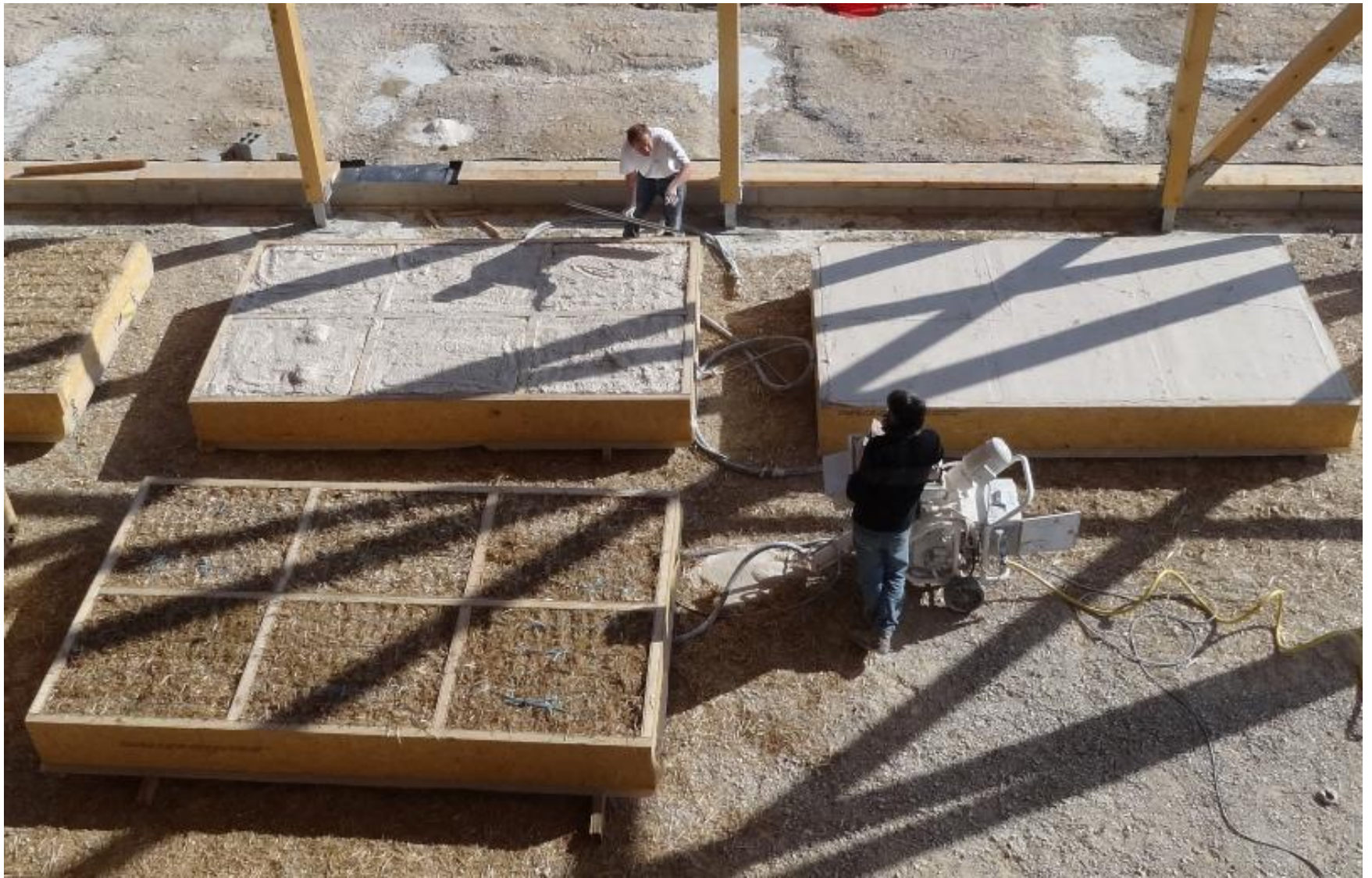
Salle de spectacle à Mazan (Vaucluse) – 2012 – Mise en œuvre de la première couche de plâtre : le « renformis » Maître d'ouvrage : Commune de Mazan – Architectes : François DEFRAIN – Olivier SOUQUET