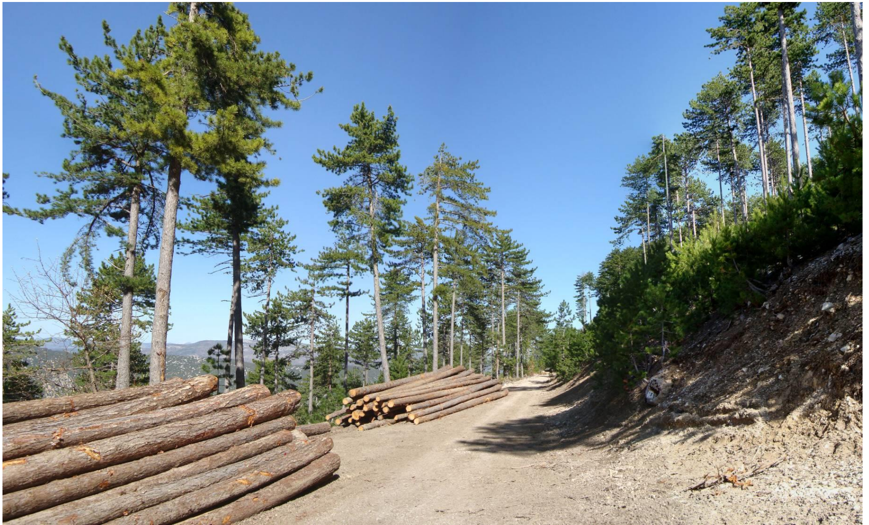
Salle de spectacle à Mazan (Vaucluse) – 2012 – Les grumes de pin noir en bord de route Maître d’ouvrage : Commune de Mazan – Architectes : François DEFRAIN – Olivier SOUQUET