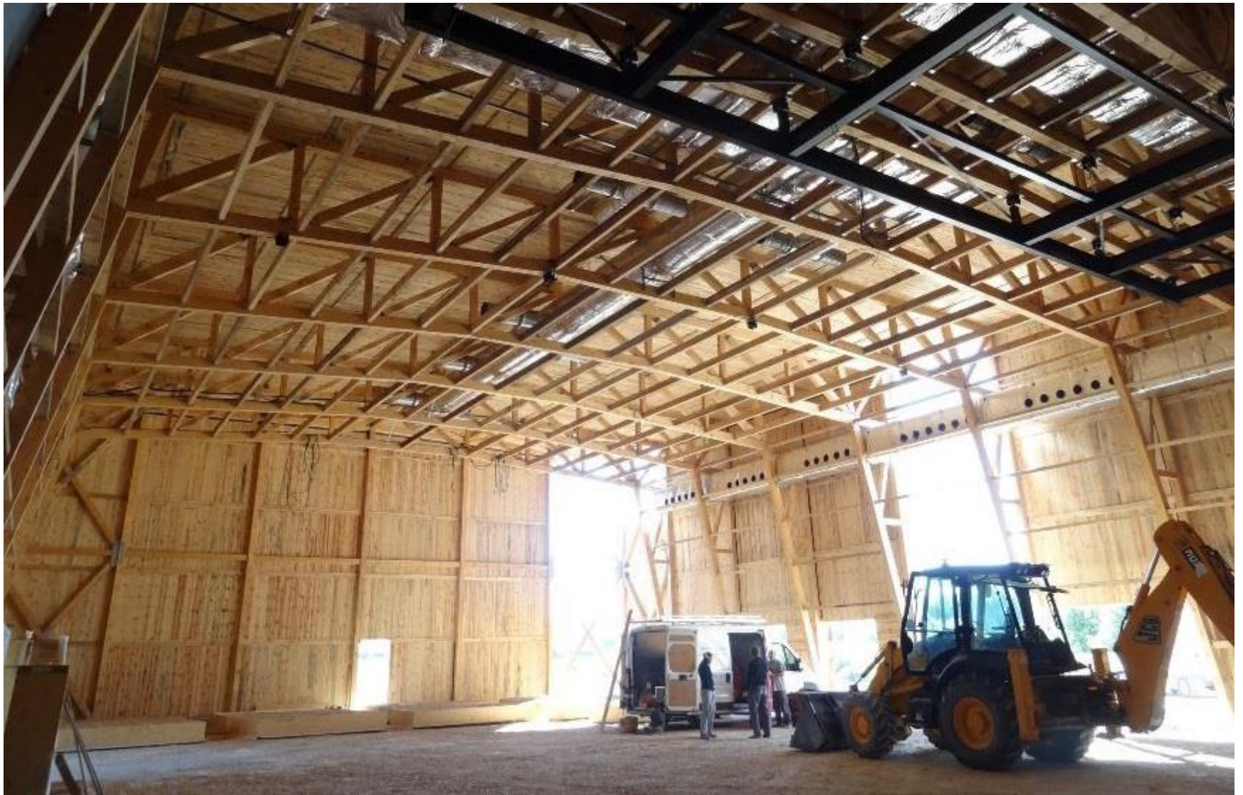
Salle de spectacle à Mazan (Vaucluse) – 2012 – Mise en œuvre des panneaux de façade Maître d'ouvrage : Commune de Mazan – Architectes : François DEFRAIN – Olivier SOUQUET