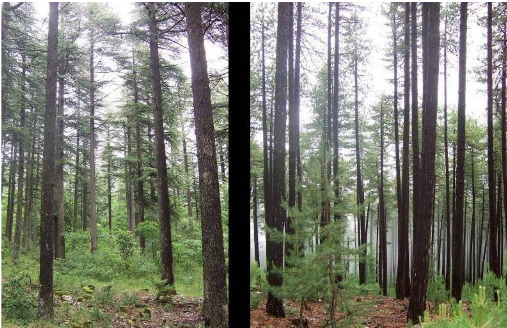
Salle de spectacle à Mazan (Vaucluse) – 2012 – Pins noirs du Mont Ventoux pour la structure et l'ossature bois Maître d'ouvrage : Commune de Mazan – Architectes : François DEFRAIN – Olivier SOUQUET